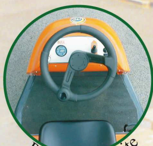
Poste de conduite