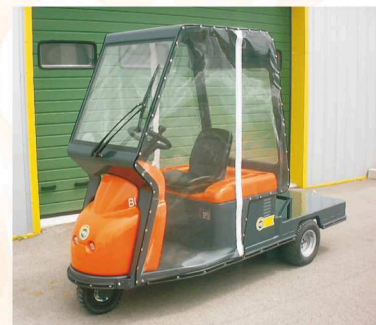
Options cabine + portes souples