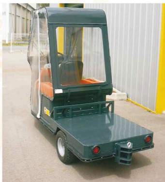
3 dimensions de plateau possible