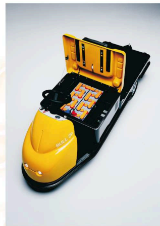
Tracteur fonctionnel et robuste