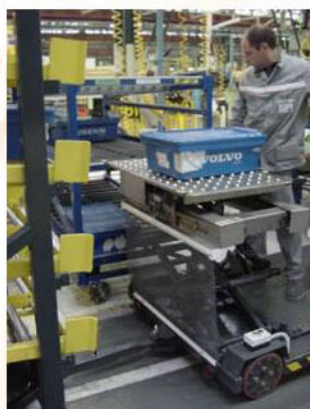
Ergonomie optimisée pour transfert de bacs lourds sur meuble bord de ligne