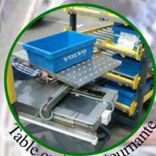
Table croisée + tournante