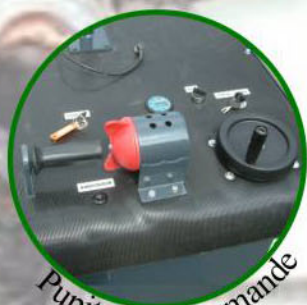
Pupitre de commande