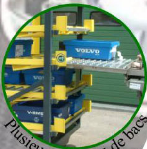
Plusieurs niveaux de bacs