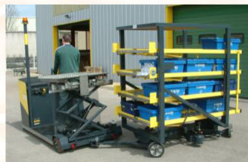
Très grande maniabilité avec remorque monorace